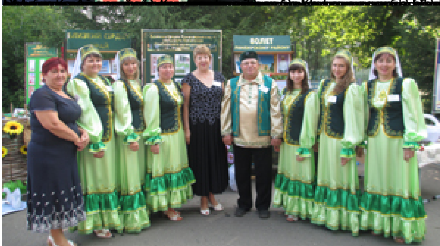
Сабантуй - это праздник, который объединяет всех жителей Республики Татарстан.