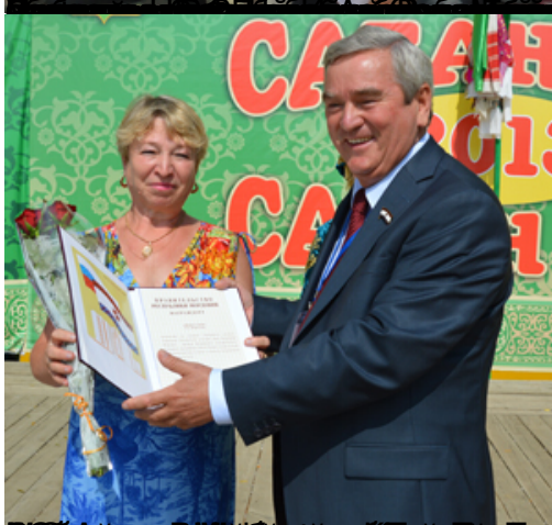
Сабантуй - это праздник, который объединяет всех жителей Республики Татарстан.