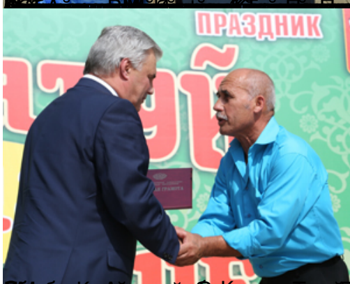
Сабантуй - это праздник, который объединяет всех жителей Республики Татарстан.