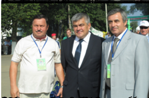
Участники праздника в городе Агры, Республика Татарстан.