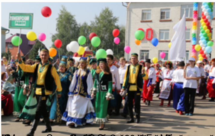
Участники народного праздника Сабантуй в городе Агры, Республика Татарстан.