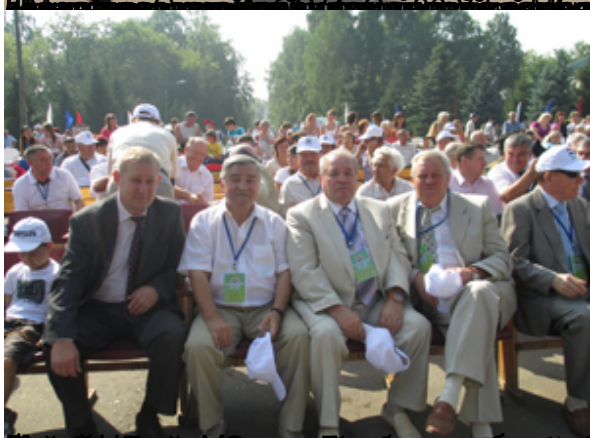
Гости и участники праздника в городе Агры, Республика Татарстан.