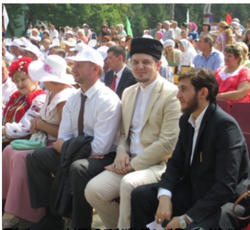
Сабантуй - это праздник, который объединяет всех жителей Республики Татарстан.