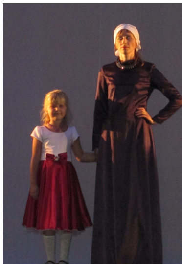
Бу костюмның исеме нилә? Костюмның авазы һәм килеми,...