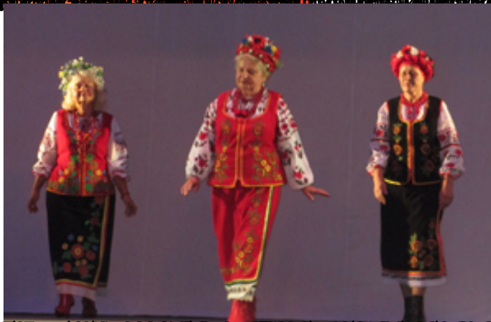
«Ташкент» Республикасы, «Ташкент» Республикасы, «Ташкент» Республикасы»