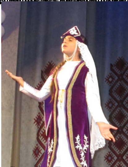
Бул костюмның исеме нилә? Костюмның авазы һәм килеми...