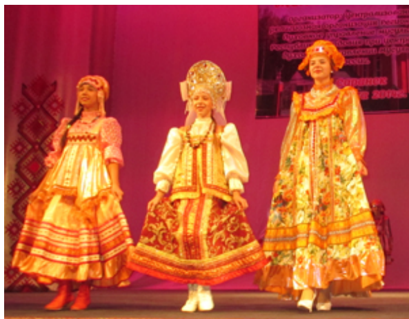
«Ташкент» Республикасы, «Ташкент» Республикасы, «Ташкент» Республикасы»